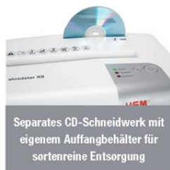
Separates CD-Schneidwerk mit eigenem Auffangbehälter für sortenreine Entsorgung